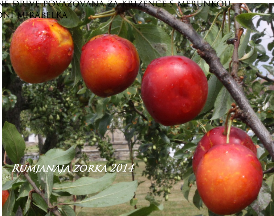
RUMJANAJA ZORKA 2014

PĚSTUJE I DALŠÍ OVOCNÉ DRUHY, ZEJMÉNA DROBNÉ OVOCE, OŘECHY, MÉNĚ ZNÁMÉ OVOCE A TROPICKÉ.