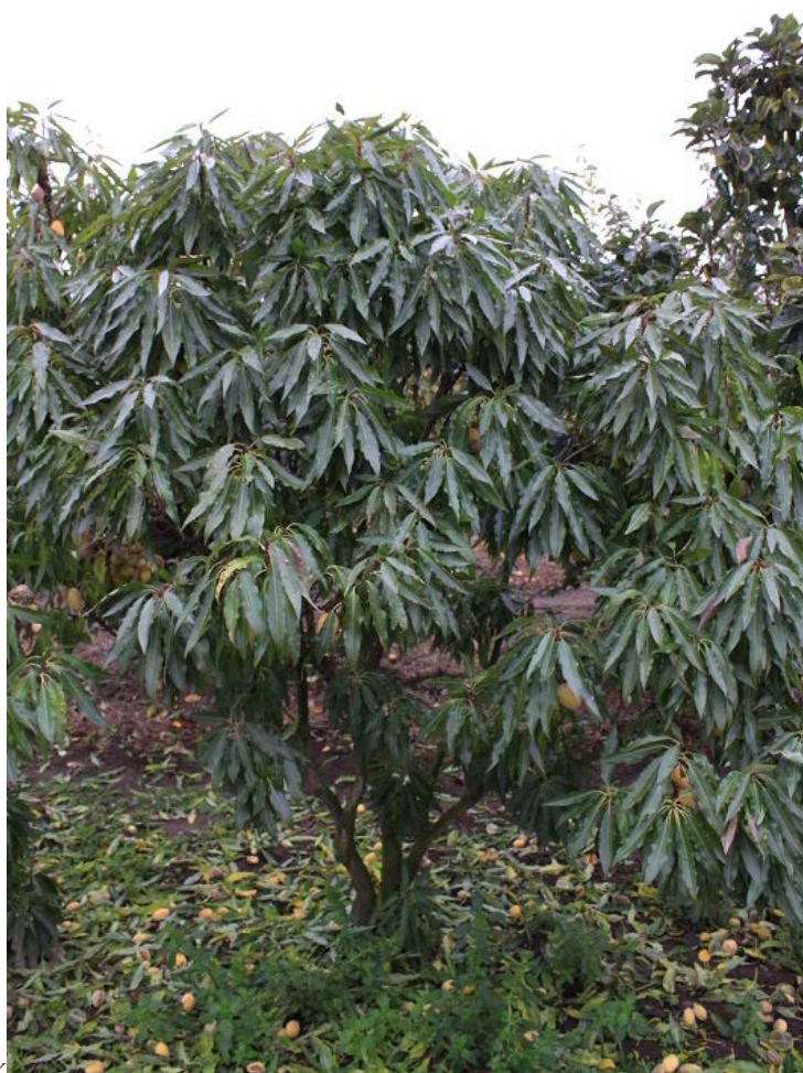
MANDLE ZAKRSLÁ S OPADANÝMI PLODY